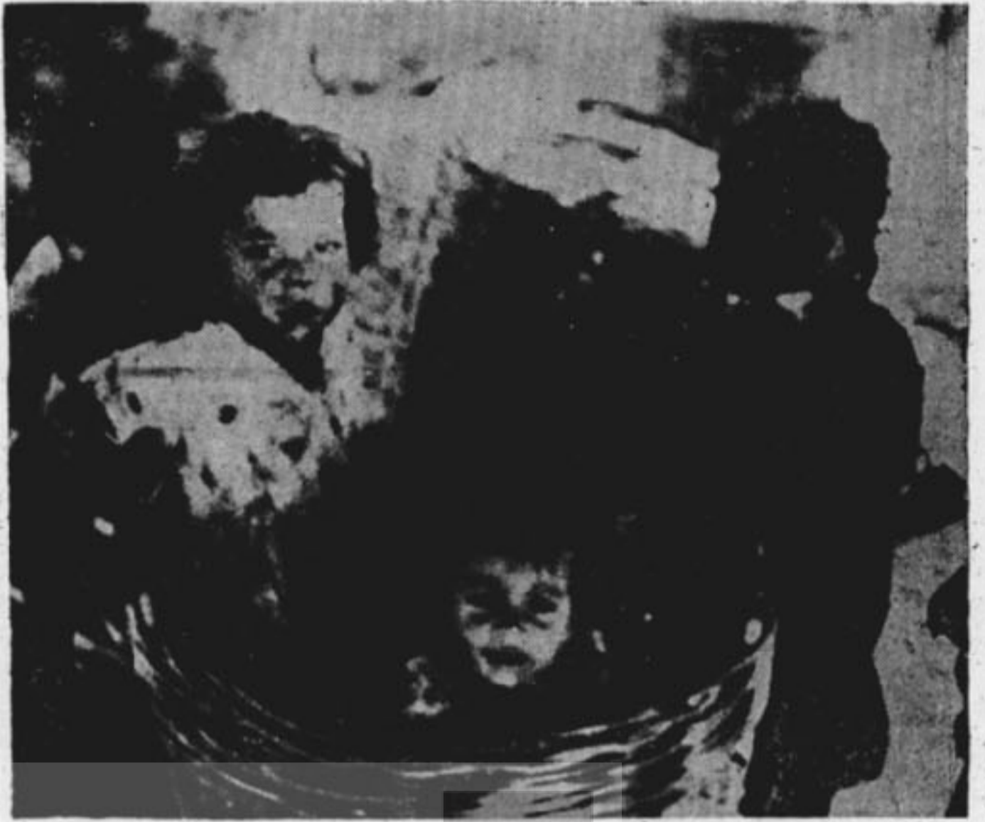
Büyük bir umursamazlıkla terkedilen bu çocukların sorumluluğu ne zaman anlaşılacak?

İşte, yetiştirmek istedikleri öğrencilerden birkaçı... Kokmuşlar Saltanatı'nı sürdürmek için, onların istediği öğrenci ve öğretmen tipi budur. Gericiğe gübrelik görmevi yapan bu baylar, gümbür gümbür yıkılıp gidiyorlar. Fakat ülkeye ettikleri kötülüğün kökü kolay kolay kazınamıyor. Okul yok, öğretmen yetişmiyor, yetişen öğretmen yetmiyor, öğrenciler her bakımdan zayıf kalıyorlar. Bugün fakülteler, yüzde doksanı yukarıdaki gibi olan öğrencilerle doludur. Ama suç bu öğrencilerde değil; suç, böyle öğrenci yetiştirmeyi amaçlayan sistemdedir. Bu sistemin sürdürülenlerdedir. Anayasa çarpışın kefereleri!