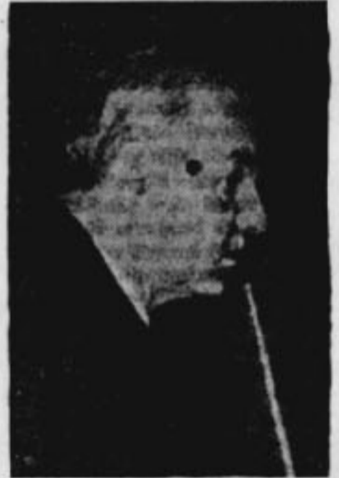
Suat Hayri Ürgüplü