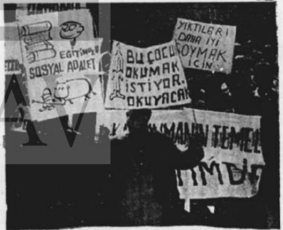
Bu seslere kulak verilmelidir

Adresime gelen Yön, Vatan gibi gazeteleri yırttığını; Yeni İstiklal'i, Toprakı da sahiplerine eliyle verdiğini -cümle âlem bilir. Ayrıca bavulumda bulunan; Makal'm Başaran'ın, A. Ne.