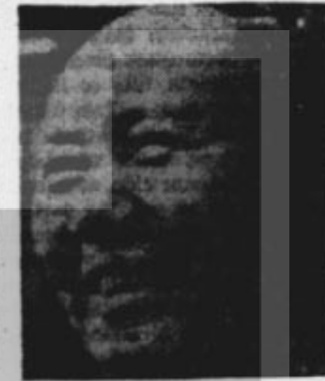
Mao Çe Tung

İkinci Dünya savaşında büyük yük kayıplara uğramış olan Sovyetler Birliği savaşta sonra sosyalist bir toplum kurma yolundaki hamlesini büyük ölçüde yeniden başlamak